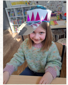
Taalthema 'Hoeden en deksels'