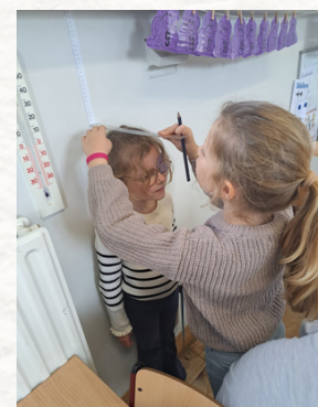
Hoekenwerk 'Metend rekenen' en 'Tafels oefenen'