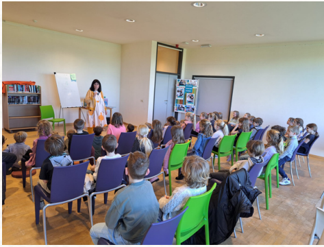
Auteurslezing in de bib